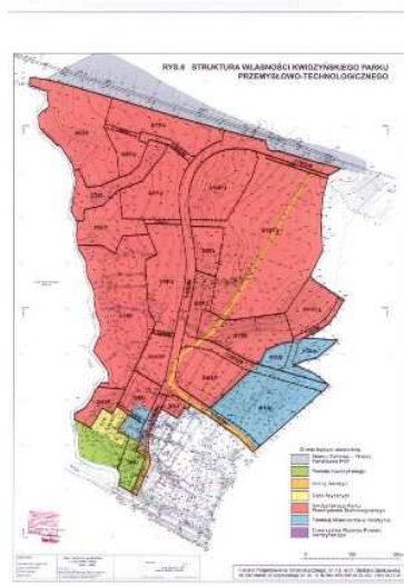
Mapka na końcu dokumentu